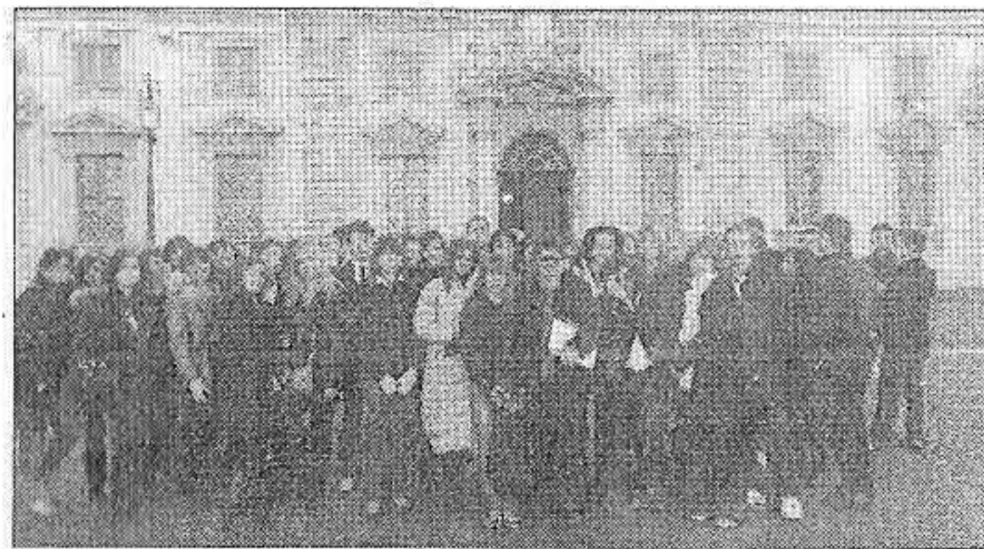
Viaggio importante Alcune immagini della visita degli studenti dell'istituto "Federico Cesi" alla Corte costituzionale